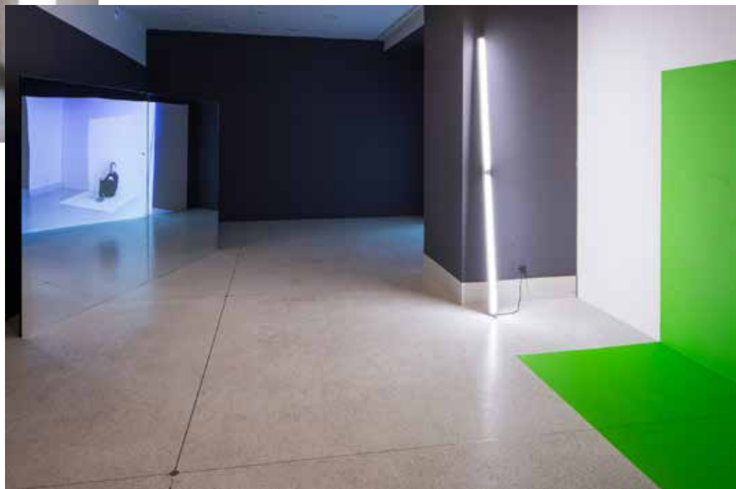
Richard Loskot, Brava je to, co není, 2014