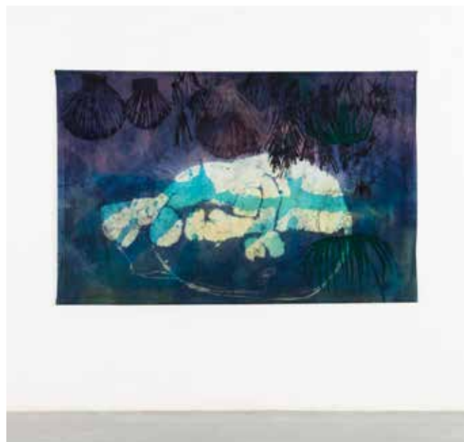
Viktorie Valocká, Clay head, 2016